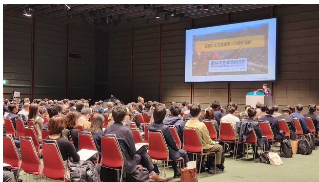
▲ 農業専門家による基調講演