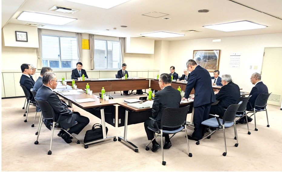
▲ 第1回臨時理事会の様子