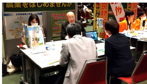
▲ 北海道と当公社の相談ブース