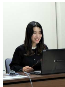
◀ 司会進行の太細アナウンサー