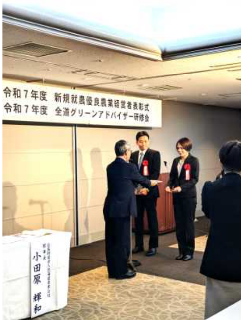
▲ 当会社・小田原理事長から表彰状を授与