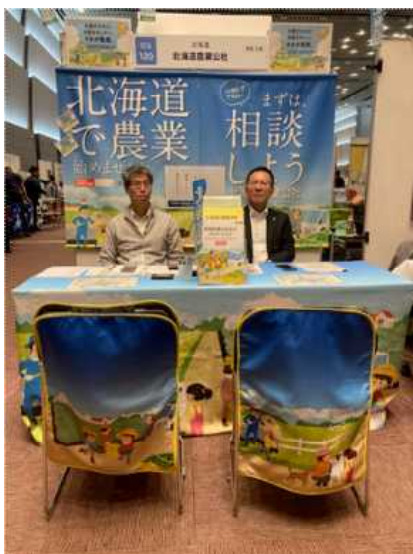
▲ 当公社の相談ブース

当公社も「北海道で農業を始めませんか」の相談ブースを、道内から参加の40か所の地域担い手育成センターや農業法人等の皆さんとともに出展し、魅力ある北海道農業のPRや就農へのアドバイス等に関西圏の方々を中心に行いました。来場者からは「北海道で酪農の仕事をするにはどうしたら良いか？」「家族で移住して新規就農したい！」「農業っていくらくらい儲かるのか？」・・・など、様々な質問や相談を受け、その熱い思いが直に伝わってきたのが大変印象的でした。