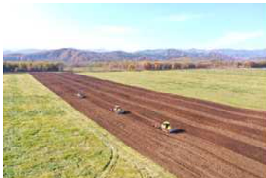
▲ 機械施工実施状況