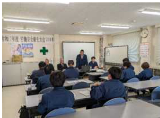
▲ 農用地開発整備事業 座学研修

今後とも、これら技術をしっかりと「地域に還元」できるよう、組織一丸となって人材育成と技術継承に取り組んでまいります。