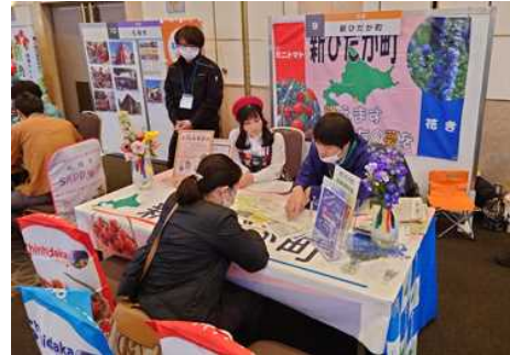
▲ 先輩就農者もブースで対応