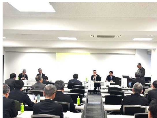
▲ パネルディスカッションの様子