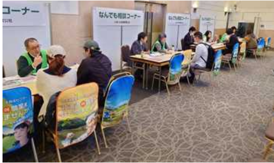
▲ 当会社の「なんでも相談コーナー」

次回開催は今年の7月5日（土）・6日（日）で、初の「 2日制開催 」にチャレンジします！