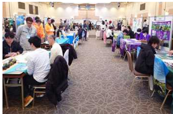
▲ 途切れない相談者、相談者…