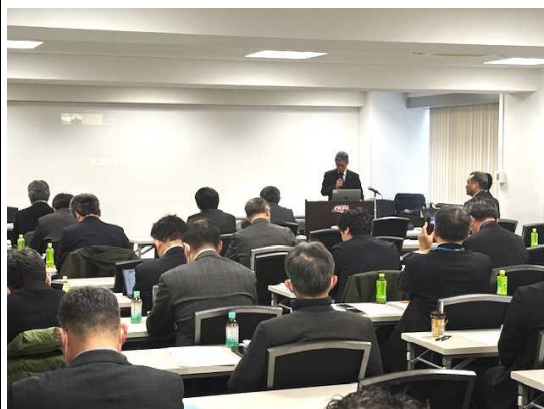
▲ 小田原会長挨拶及び講演