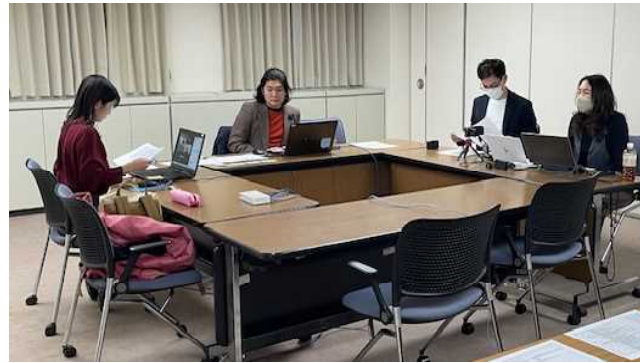
▲ スタジオの様子（当公社会議室）