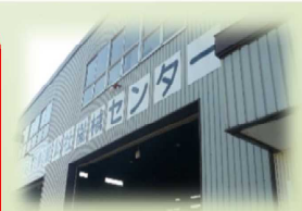
《公社機械センター》

※感染症（新型コロナ・インフルエンザなど）を防ぐための室内喚起・消毒なども併せて実施