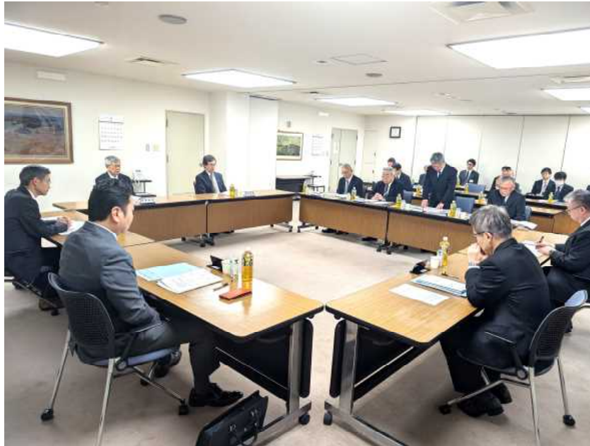
▲ 第2回臨時理事会の様子