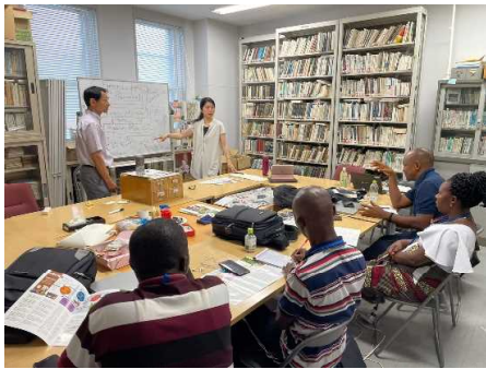
▲ 北大農学部内での講義