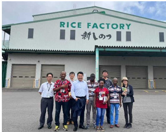
▲ J A新しのつ の米貯蔵施設にて