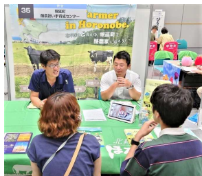
▲ 幅広い層の来場者