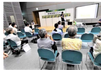
▲ 先輩就農者の話を聞けるミニセミナー

次回の当公社主催のフェアは、来年3月を計画しています。出展者・来場者双方の「満足度向上」をめざして準備に取り組みます。