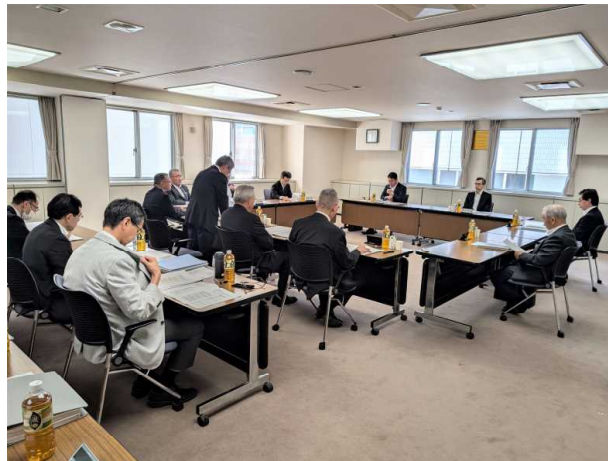
▲ 第2回通常理事会の様子

議事については、「令和6年度事業の進捗及び収支見通し（8月末現在）」などについて報告を行う中、役員から地域の状況等を踏まえた多様な意見が出されるとともに、決議事項である「固定資産等の取得及び導入」などについて審議が行われ、全会一致で承認されました。