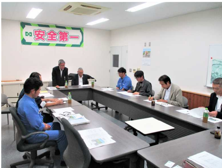
▲ キックオフ会議の様子（理事長挨拶）