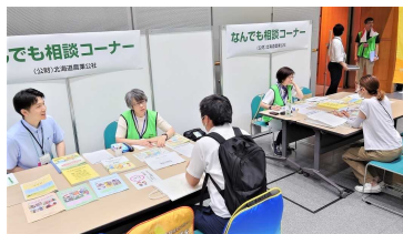
▲ 迷ったら当公社のブースへ