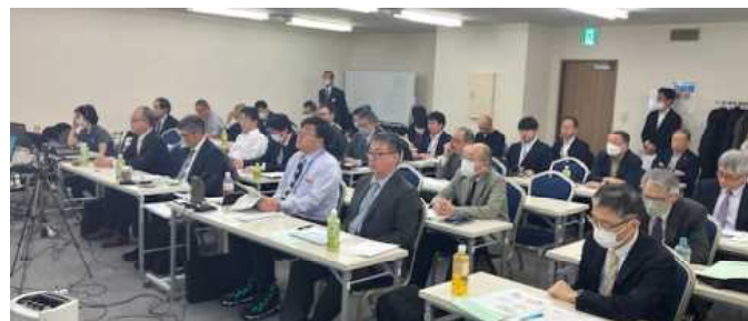
▲ セミナー会場の様子