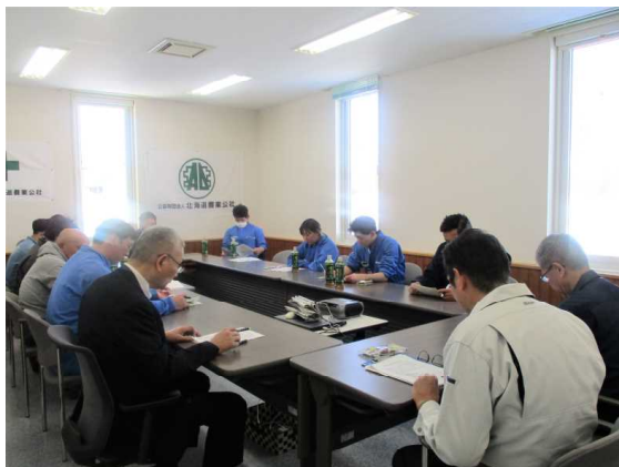
◀ 第3回農場HACCP等研修会の様子

過去1回目（R5. 7. 24～25）は当牧場内の現地調査・指導及び農場HACCPの概要や取組によるメリット等の説明、2回目（R5. 10. 26～27）では牧場内における現地指導（＝改善点の確認など）と衛生管理プログラムの事前整備にもなる作業手順等の説明、そして今回3回目は、令和6年度に向けて、これまでの研修内容の再確認、ポイントとなる作業手順や飼養衛生管理について説明を受けました。