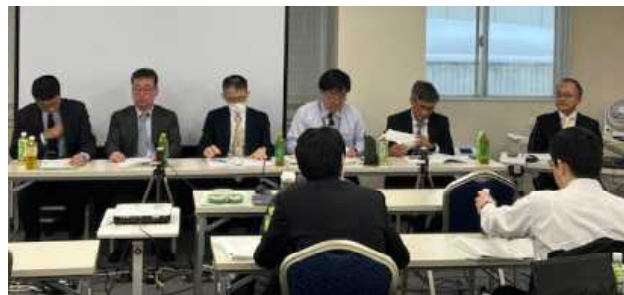
▲ パネルディスカッションの様子