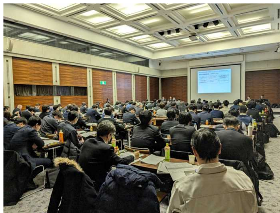
旭川会場 の様子 ▶

令和6年4月から実際に農用地利用集積等促進計画を用いて農地の権利移動を行う市町村は道内で3市町村の予定であり、残りの市町村は令和6年度中に地域計画を策定することとなります。今後、地域計画の策定にあたり、関係機関・団体と連携しながら本支所一体で支援に努めるとともに、計画策定後の効率的な事務処理方法などについて、さらに検討・改善を図ってまいります。