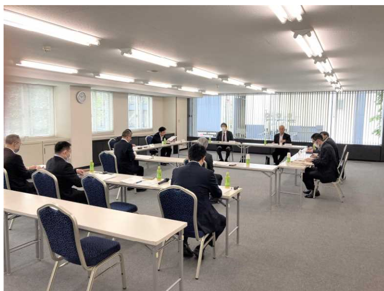
▲ 評価委員会の様子

評価委員からは、担い手への農地集積率が9割を超えている本道と府県との相違、各地の農業委員の活動を通じた円滑な賃貸や売買の実現、農地中間管理機構と市町村農業委員会等関係機関・団体との連携の重要性など、農家戸数の減少が続く中、地域の実情等を反映した様々な意見が出されたところです。