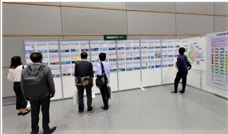
◀ 好評の「市町村PRコーナー」

引き続き、相談者・出展者の双方にご満足いただけるよう、事前の告知や相談環境の整備に取り組みます。皆さん、お疲れさまでした！