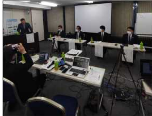
▲ パネルディスカッションの様子