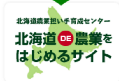
▲ 当社の新規就農希望者向けサイト