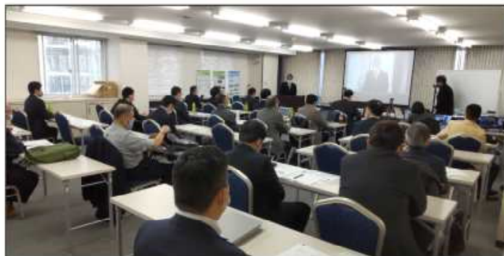
▲ セミナー会場の様子