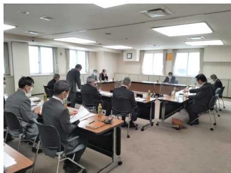
▲ 第4回通常理事会の様子

なお、第4次中期経営方針については、所定の手続きを経て、令和5年度事業計画書及び収支予算書と同様に、近日中に当社ホームページに掲載の予定です。