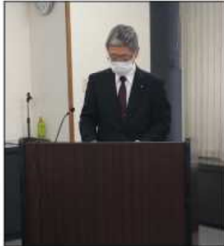
▲ 小田原会長（二当公社理事長）挨拶