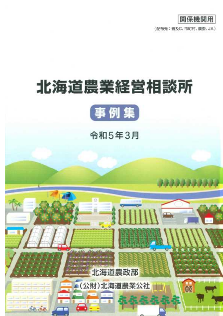
▲ 北海道農業経営相談所 事例集