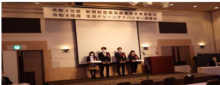
▲ 表彰式（令和4年12月15日開催）の様子