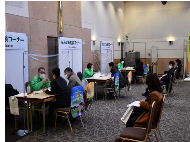
▲ 過去の新規就農フェアの開催状況 ▲