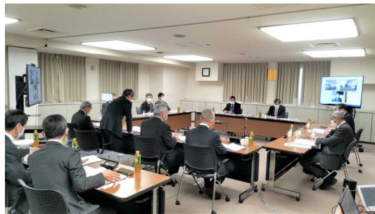
▲ 第2回臨時理事会の様子

農業をめぐる近年例のない厳しい情勢は、当公社の経営にも目に見える形で影響を及ぼしていますが、年度末に向けて、一層の収支改善に取り組んでいくこととしています。