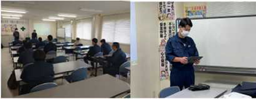
◀ 座学研修 (帯広支所機械センター)

これらの技術を「地域に還元」できるよう、組織が一丸となって人材育成及び技術継承に努めてまいります。