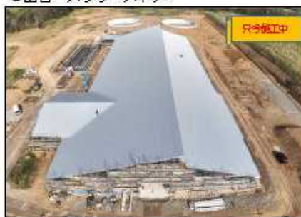
○畜舎・スラリーストア