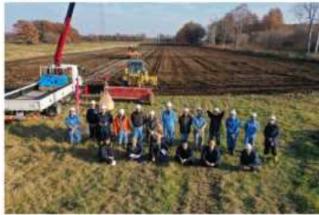
◀ 現地研修 (十勝育成牧場) ▼ ▼