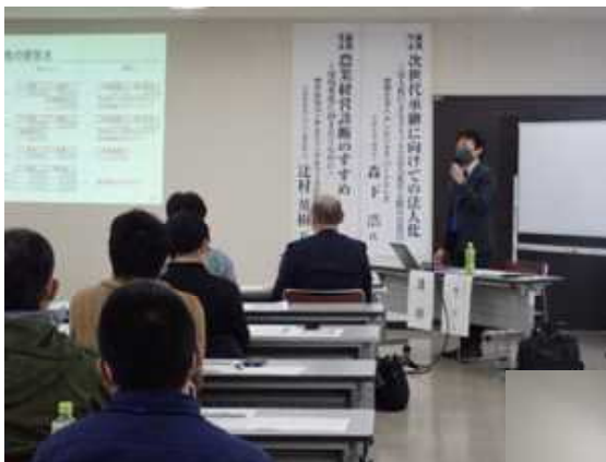
◀ 農業経営セミナー

中小企業診断士、税理士、社会保険労務士、農業法人経営者、 農業経営アドバイザー等多数在籍 : 103名(R4・10・1現在)