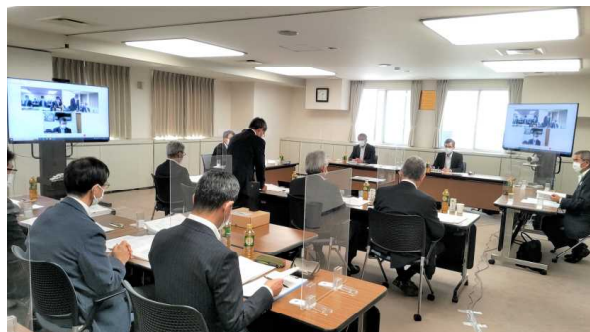
▲ 第2回通常理事会の様子

議事については、「本年度事業に関する8月末現在の進捗状況や収支の見直し」、「第4次中期経営方針の策定に向けた取組状況」、「令和5年度国費予算概算要求に係る公社関連の事業の状況」のほか、「人・農地など関連施策の見直しに係る対応」などについて報告を行い、理事・監事から熱心な質疑等が出されるとともに、決議事項である「令和5年度リース資産の導入」について審議が行われ、全会一致で承認されました。