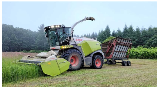
▲ フォーレージハーベスター (ダイレクト式で刈取と裁断を同時に実施)

今年もおかげさまで2番牧草の生育も順調で、収穫等も終了し、1年間の粗飼料を十分確保することができました。優良な乳用牛が育つことを、牧場職員一同、心から期待しています。