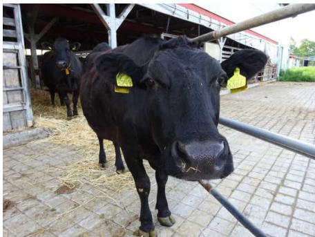
▲ 十勝育成牧場繋留の和牛 (共進会とは無関係です。)

今月10月6日（木）～10日（祝・月）にかけて、5年に1度の和牛日本一を決定する共進会が鹿児島県にて開催されます。