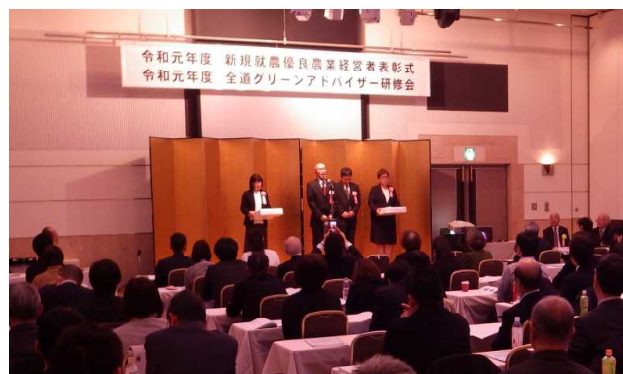
▲ 表彰式の様子（令和元年度）