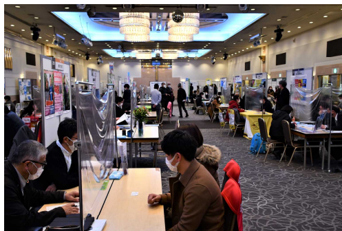
◀フェアにおける就農相談の様子

コロナ下でどれくらいの方々が訪問していただけるか心配をしておりましたが、前年度並みの138名が来場されるとともに、訪問された相談ブース数も多く、参加した市町村等の皆さんの満足度も高い結果となりました。