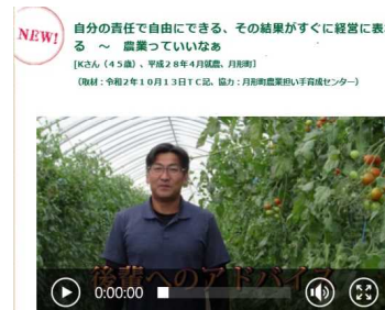
(頑張ってます！新規就農者)