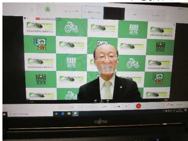
（竹林会長（当公社理事長）開会挨拶）