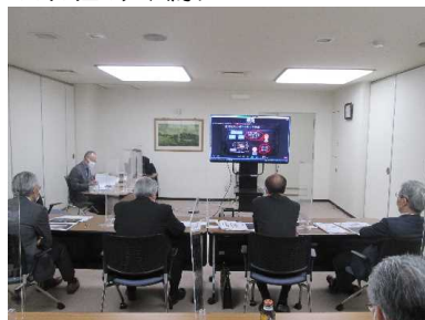
（当公社内会場の様子）

▼ 北海道高度情報化農業研究会HP http://www.bpe.agr.hokudai.ac.jp/hai/