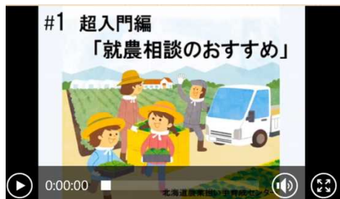
(就農相談のおすすめ)